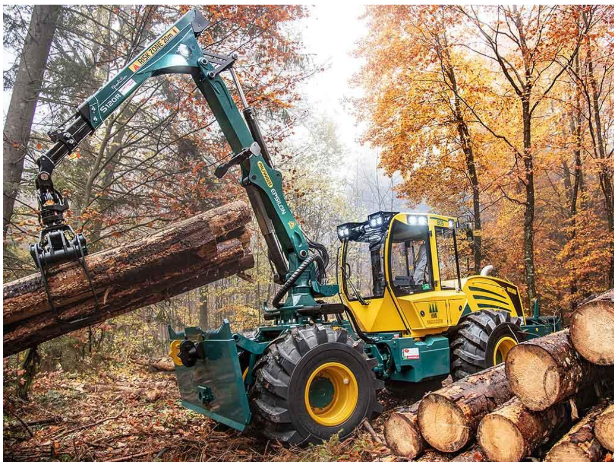
Obrázek je pouze informativní a obsahuje prvky výbavy na přání.

Údaj o zápisu: Společnost zapsána u Krajského soudu v Hradci Králové v oddílu C, vložce číslo 23381 IČO:27511529 DIČ:CZ27511529